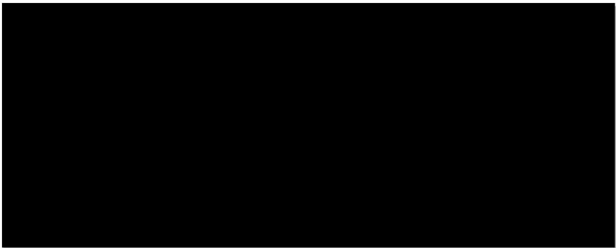
Tabulka č. 1 – vykazování a fakturace výroby FVE v roce 2013

Na základě měsíčních výkazů o výrobě elektřiny a dokladů o výplatě podpory, poskytnutých OTE, a.s., byla provedena analýza množství elektřiny, na které byla nárokována podpora dle zákona č. 165/2012 Sb. v kontrolovaném období.